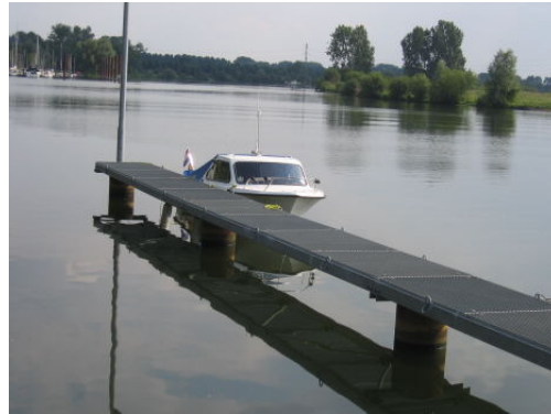
Ortsanleger von Asselt

Da wir schon Zugang zum Ort hatten, genossen wir einfach ein herrliches Abendessen im Ort mit Blick auf den Asselter Plaasen. Dann ging es zurück zum Boot. Tisch aufbauen, DVB-T und Laptop raus, das Buch rausgekrant und schon erlebten wir einen herrlichen lauen Sommerabend, so richtig rumgelümmelt auf unserer Liegebank.