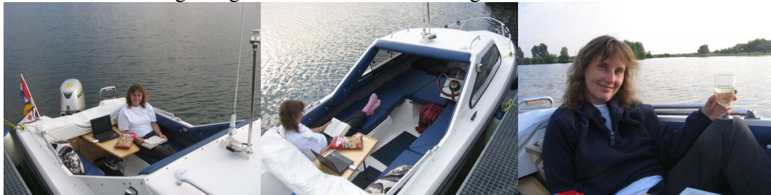
Sekt, Flips, Buch und Fernseher – was möchte man mehr !

Da wir schon Zugang zum Ort hatten, genossen wir einfach ein herrliches Abendessen im Ort mit Blick auf den Asselter Plaasen. Dann ging es zurück zum Boot. Tisch aufbauen, DVB-T und Laptop raus, das Buch rausgekrant und schon erlebten wir einen herrlichen lauen Sommerabend, so richtig rumgelümmelt auf unserer Liegebank.