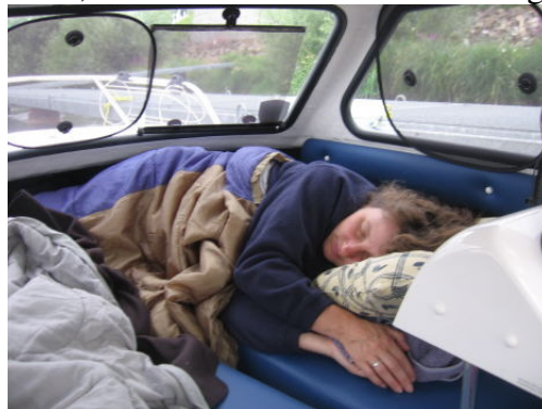
Wer schläft denn da noch um 8:00 Uhr ?

Um 21:30 Uhr zogen wir dann unser Verdeck hoch und bauten unsere Liegewiese auf. An der müssen wir noch etwas verändern. Innerhalb der Nacht haben wir mehrfach die Schlafposition gewechselt, weil es fehlt halt noch die Erfahrung - wie schläft man am besten. Am Morgen wecken durch Entenrufe, Schiffsschrauben und einer aufgehenden Sonne.